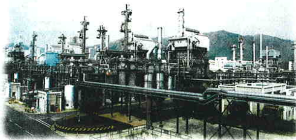
▲自1993年起，煤氣公司的大埔煤氣廠已推行一套有效的環境管理制度。

善的環保政策能夠有助開拓新商機，提升市場競爭力。他續說，今年獲得「環保成就」大獎的香港中華煤氣有限公司非常重視環保文化，早在1992年，該公司已設立環保工作委員會，舉辦各類環保活動，並於1999年成立12個環保附屬委員會，制定、實施、監控和檢討公司的